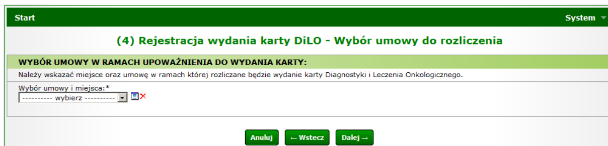
Rysunek 8 Przykładowe okno (4) Rejestracji wydania karty DiLO w AOS

Ostatni krok uzupełniania danych wymaga wybrania umowy i miejsca udzielania świadczeń, w ramach której nastąpi rozliczenie świadczeń związanych z wydaniem karty DiLO.