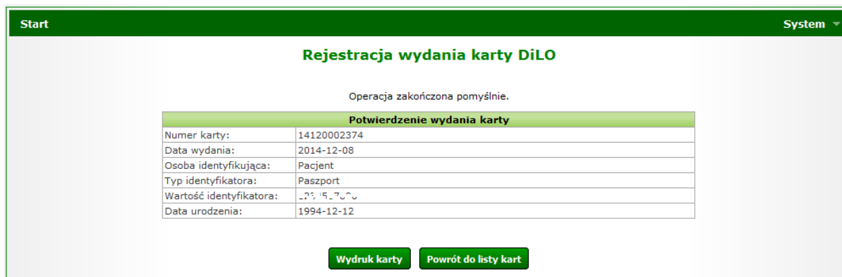
Rysunek 9 Przykładowe okno potwierdzenia wydania karty DiLO w AOS

Operacja zatwierdzania rejestracji wydania karty DiLO spowoduje wyświetlenie okna Potwierdzenia wydania karty . W oknie tym wyświetlone zostaną podstawowe dane identyfikujące kartę DiLO.